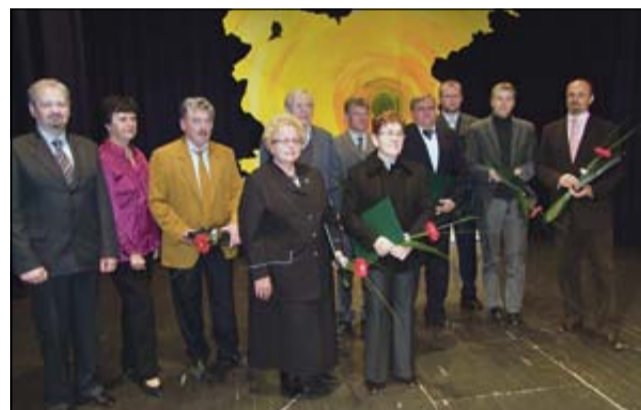
Letošnji nagrajenci ob krajevnem prazniku

Senovo, ki se je kot naselje začelo razvijati v 13. stoletju ob vznožju vzpetine Arme in Senovškem potokom, je zaznamovala najdba premoega okoli leta 1800. S tem se je začelo priseljevanje delavcev - rudarjev tako v sam kraj kot tudi v bližnja naselja: Reštanj, Mali Kamen, Šedem, Dobrova, Brezje, Kališevce, Gorenji Leskovec, Stranje in Dovškem. ki še danes tvorijo območje KS, s skupno nekaj preko 4.000 prebivalci. Upernega duha in trdega dela vajeni revirici niso klonili tudi med 2. sv. vojno. Čeprav je bilo mnogo družin izgnanih, so se močje množično pridružili partizanskemu osvobodilnemu gibanju, največ znameniti XIV. diviziji, ki je v noči iz 9. na