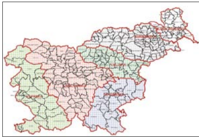
Zemljevid pokrajin, delovno gradivo

Sevniški župan Srečko Ocvirk pravi, da je predlog nove regionalne razdelitve Slovenije za veliko število slovenskih županov milo rečeno nesprejemljiv. „Predstavljeni predlog žal ne upošteva nobenega do sedaj doseženega konsenza v slovenskem prostoru glede oblikovanja pokrajin, niti ne upošteva obstoječih delitev Slovenije na statistične in razvojne regije. Tak nedodelan pristop k regionalizaciji vnaša negotovost