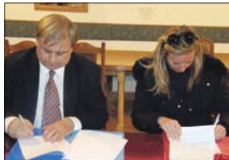
Podpis pogodbe v Cvičkovem hramu