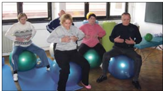
Člani združenja med telovadbo v sobi zdravja

BREŽICE - V Združenju gibalno oviranih invalidov in oseb z invalidnostjo Brežice so takoj po novem letu pričeli izvajati nov program za ohranjanje zdravja in kondicije invalidov in bolnikov. Odprli so prostor, ki so ga poimenovali »soba zdravja«, v