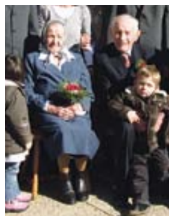
ZAKONCA BEBAR IZ CEROVCA

Diamantni bo sledila še »železna« poroka