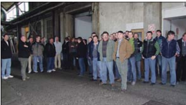
Delavci bi raje delali kot stavkali, saj imajo naročil za delo dovolj, žal pa nimajo surovin.

Pa tudi surovin za delo ne, pa čeprav imajo trenutno naročil za delo kar v vrednosti 450.000 €. Potem ko so v decembru lani in v letošnjem januarju še uspeli realizirati večje naročilo, to je izdelavo pohištva za verigo hotelov v Amsterdamu, so morali zatem zaradi pomanjkanja