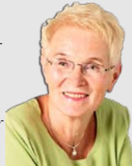
Piše: Natja Jenko Sunčič

Te dni smo pogosto slišali besedo latinskega izvora - »virtualnost«. Pomeni navideznost. In drugo besedo istega izvora »virtuelen«, ki prevedena pomeni mogoč, možen. In če gremo korak dalje, se smemo ustavititi še ob virtualni sliki, to je navidezni sliki. Če še nekoliko popešavimo, prispemo do virtualnega sveta. Pridemo do navideznega sveta. Pridemo do nerealnega, neresničnega sveta. Do sveta, ki ga ni mogoče ujeti »v zaslon«. Kajti, slike se vrtijo, se izmenjujejo tako naglo, da je ob njih težko pošteno postati. Jih delček posrkati. Jih malo podržati, da se vsaj malo zrasede s človekovo biti. Jih malo utrditi v sebi.