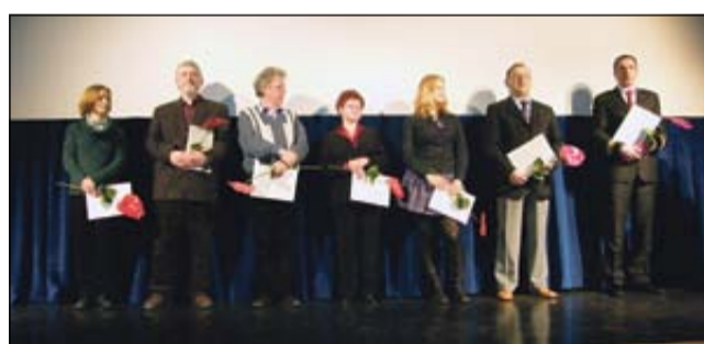
Brežiški prejemniki Prešernovih priznanj in odličij