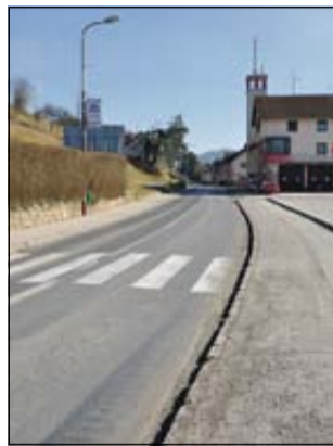
Tretja faza ureditve zajema 500-metrski odsek vozišča od gasilskega doma do križišča pri Plauštajnerju.