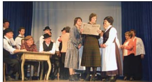
Na odru se je zvrstilo veliko nastopajočih.

PODBOČJE - Na predvečer kulturnega praznika je Kulturno društvo Stane Kerin Podbočje tradicionalno pripravilo priložnostno prireditev. Na odru tamkajšnjega kulturnega doma so se zvrstili številni člani društva, od najmlajših do najstarejših. V programu sta sodelovali obe pevski skupini, ki de-