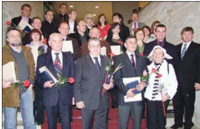
Skupinska fotografija dobitnikov Prešernovih plaket in priznanj za leto 2010 v občini Krško