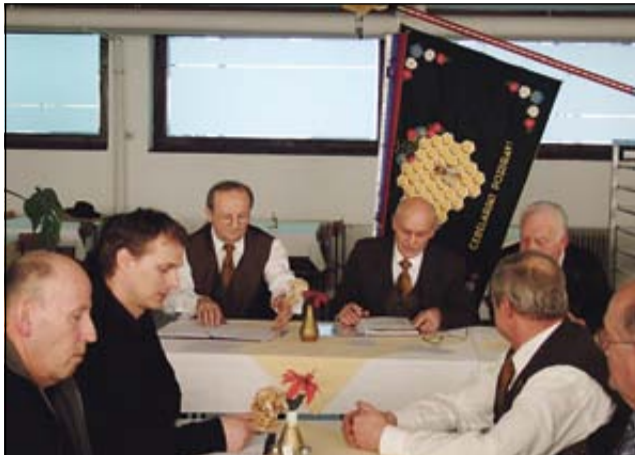
Z zbora sevniških čebelarjev

SEVNICA - Sevniški čebelarji so se 5. februarja srečali na letnem občnem zboru. Seznanili so se z lanskoletno aktivnostjo upravnega odbora in komisij ter nadzornega odbora. Iz poročil je bilo razbrati, da je bilo lansko leto v delovanju