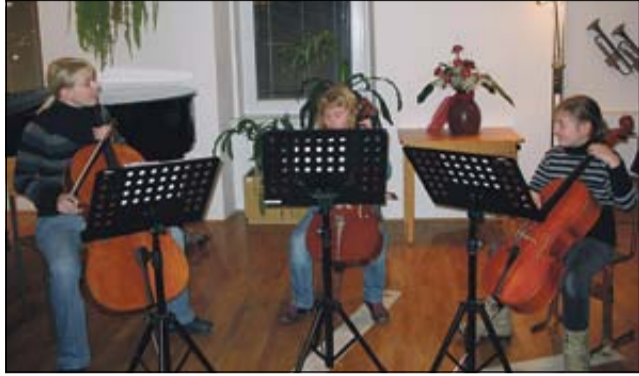
Učenci in učenske sevnške glasbene šole so skupaj z mentorji počastili slovenski kulturni praznik.

SEVNICA - V dvorani Glasbene šole Sevnica se je 3. februarja odvijal nastop učencev in učenek omenjene šole v počastitev slovenskega kulturnega praznika. Staršem in ostalim obiskovalcem so se nastopajoči predstavili z zaigranimi skladbami na posamezne instrumente in z avtorsko poezijo, ki je bila