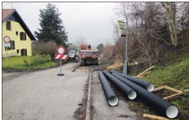
Gradnja kanalizacije v naselju Marof

Namen investicije je izgradnja sekundarnega kanalizacijskega omrežja v naseljih Marof, Veliki in Mali Obrež