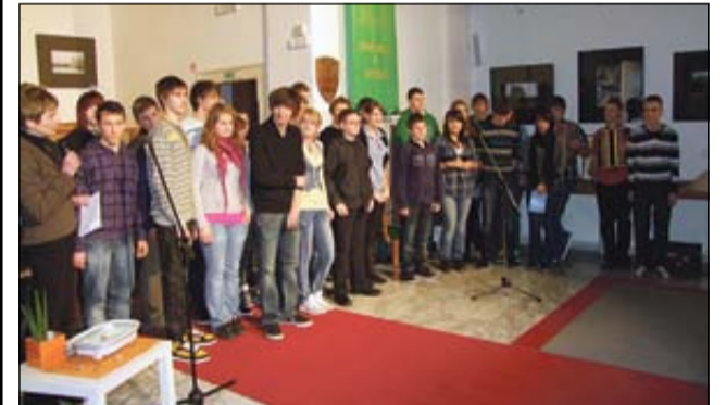
Obiskovalcem je Alma M. Karlin predstavilo kar okoli 30 dijakinj in dijakov.

Posvetili so ga pisateljici, svetovni popotnici in zbirateljici Almi M. Karlin, katere življenje in njen bogat literarni opus so vzeli pod drobnogled tudi preko priprav na letošnje tekmovanje v materinščini za Cankarjevo priznanje. Alma M. Karlin, 12. oktobra 1889 v Celju vpisana v rojstno knjigo kot Alma