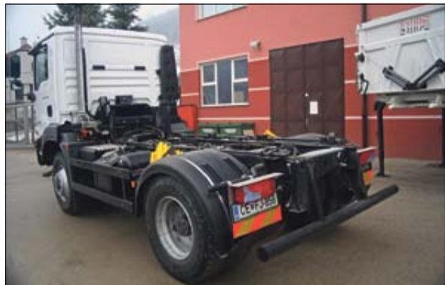
Osnovno tovorno vozilo

JP Komunalna Radeče trenutno razpolaga z dvema osnovnima tovornima voziloma ter z nadgradnjami za odvoz bioloških odpadkov, samonakladalnikom za odvoz večjih kontejnerjev, cisterno za odvoz fekalij ter kiperjem. Vsako izmed nadgradenj je moč v kratkem času namestiti na katero koli izmed osnovnih vozil. Pri opravljanju odvoza odpadkov naše podjetje tako na primer uporablja standardno smetarsko vozilo, ki je namenjeno za odvoz preostanka mešanih odpadkov, za odvoz bioloških odpadkov pa se uporablja manjša nadgradnja, ki je zaščiten proti izpustu izcednih voda.