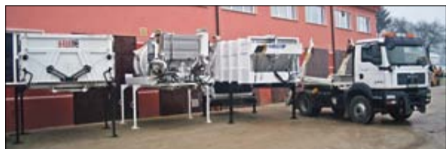
Del nadgradenj voznega parka JP Komunalna Radeče

Sistem strojnih nadgradenj, s katerim zagotavljamo optimalno izkoriščenost osnovnih tovornih vozil, predstavlja investicijsko-tehnološko usmeritev, s katero podjetje obnavlja obstoječi vozniki park, ki je star od 15 do 25 let in ne dosega niti tehničnih, kaj šele sodobnih okoljskih zahtev. Sistem temelji na dejstvu, da naše podjetje za vsakodnevno opravljanje zgoraj naštetih dejavnosti potrebuje širok nabor opreme; gre za različne vrste