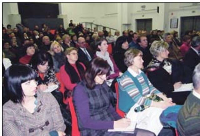
Posavke in Posavci so z množično udeležbo dokazali, da jih skrbi usoda brežiške porodnišnice.