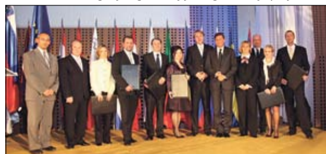
S podelitve diplom

KRŠKO - V Kongresnem centru Brdo je bila januarja slovesna podelitev priznanj RS za poslovno odličnost (PRSP) za leto 2010. Priznanje se podeljuje od leta 1998 po vzoru in merilih evropske nagrade za odličnost. Med sedmimi dobitniki diplom je Upravna enota Krško v kategoriji organizacij javnega sektorja prejela sre-