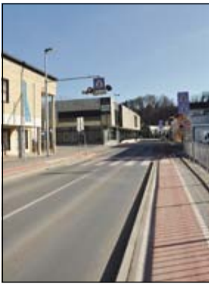
Urejeno mestno središče kot del druge etape ureditve regionalne ceste skozi Sevnico.