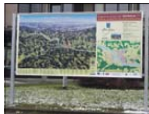
Turistična tabla v centru Sevnice

Del ciljev projekta je dvanajst (12) tabel, ki so velike tri metre krat en meter in pol (3 x 1,5). Vsebinsko so razdeljene na dva dela. Večji, skoraj dvotretjinski del celotne table, predstavlja zemljevid celotnega območja občine. Ta zemljevid je enak na vseh tablah in poleg osnovnih informacij zemljevida, kot so ime krajev, reke, ceste, železnica ... vsebuje še naslednje posebne sklope podatkov: planinske, pohodne in tematske poti (velik del zlasti pohodnih poti povzete iz Vodnika »Izleti v sevniško okolico«, avtor Vinko Šeško, 2002); kolesarske poti (povzete iz Turistično-kolesarskega vodnika Posavja, avtor mag. Boris Papac); gostinske lokale, turistične kmetije in ponudnike zidaniškega turizma; naravne znamenitosti; cerkve in druge kulturno-zgodovinske znamenitosti; splošne podatke o občini Sevnica.