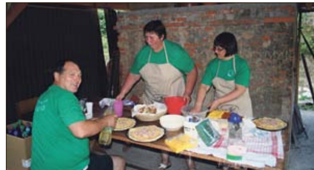
Člani TD Senovo pri pripravi dobrot iz krušne peči

SENOVO - Tako kot že nekaj let do sedaj na drugo soboto v septembru, so člani Turističnega društva Senovo tudi letošnjo, 10. septembra, namenili etnološki družabni prireditvi Dobrote iz krušne peči.