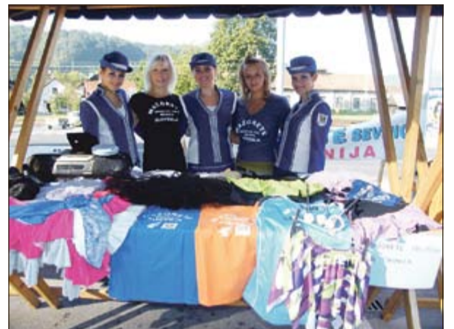
Sevniške mažoretke na festivalu v Sevnici.