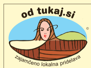
Logotip od tukaj.si