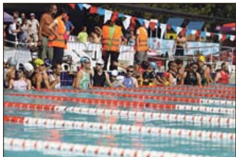
Triatlonci so najprej začeli s plavanjem v brestaniškem bazenu

BRESTANICA - 3. septembra je v organizaciji Triatlon kluba Krško na bazenu v Brestanici z bližnjo okolico potekal prvi triatlon v Posavju. Udeležilo se ga je približno 120 tekmovalcev in tekmovalke iz Slovenije in sosednje Hrvaške.