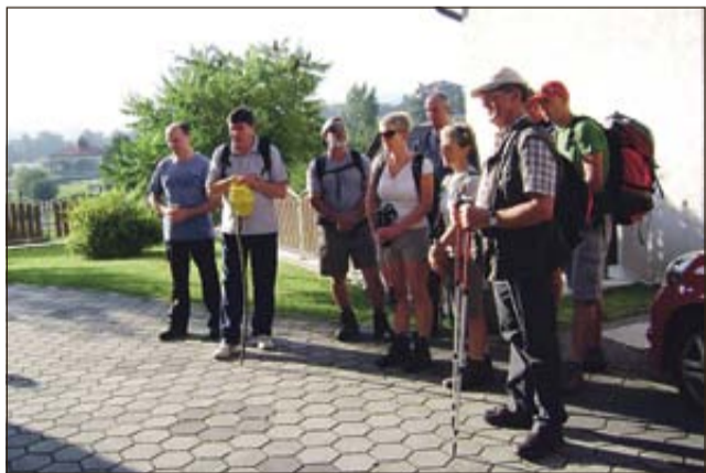
Radeški romarji na začetku poti

RADEČE, ZAPLAZ - 14. avgusta se je skupina devetih romarjev iz župnije Radeče prvič podala na peš romanje od Radeč do romarskega središča Dolenjske na Zaplazu nad Trebnjem. Romanje se je pričelo v Radečah in se nadaljevalo preko Leskovca do Šentruperta, kjer so se pridružili posamezniki z Dolenjske in radeški župnik, se skupaj ustavili na Mirni ob zna-