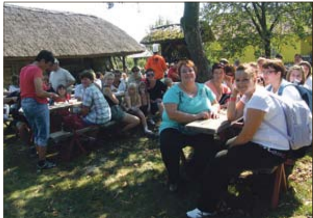
S soncem obsijana nedelja je na Banovo domačijo privabila številne obiskovalce.

rekordno, vseh kuharjev, ki so bili v ekipah in so sukali kuhalnice, pa je bilo kar okrog sto. Veseli smo, da so poleg kuharskih ekip prišli tekmovalce bodriti tudi navijači, tako da se je na kuharskem prizorišču