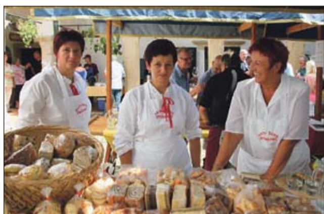
Žal se v sevniški občini ne morejo pohvaliti z blestečim finančnim stanjem, lahko pa so ponosni na aktive kmečkih žena, ki poskrbijo za brezplačne pogostitve na mnogih družabnih dogodkih. Tako je bilo tudi na Festivalu modre frankinje na sevniškem gradu, kjer so se z bogato ponudbo izkazale članice studenskega aktiva.