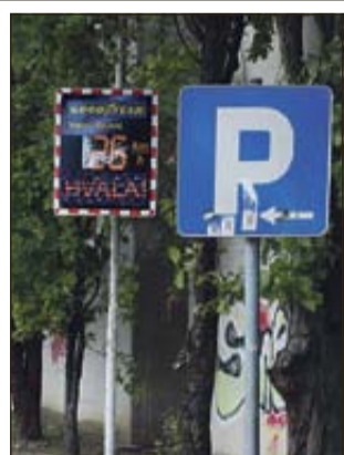
Prikazovalnik hitrosti pri Osnovni šoli Sava Kladnika Sevnica

BOŠTANJ, SEVNICA - Na parkirišču podjetja Sava avto v Dolenjem Boštanju so 8. septembra predstavniki podjetja Goodyear Dunlop Sava Tires iz Kranja skupaj s predstavnicami enainštiridesetih VULCO servisov iz vse Slovenije, policistov Policijske postaje Sevnica, župana občine Sevnica in predstavnikov občine, ki skrbijo za preventivo in vzgojo v cestnem prometu, ter Goodyearjeve ambasadorke varnosti, pevke Alenke Godec, predstavili ukrepe za boljše varnost v cestnem prometu in nato podelili odsevne brezokavne ter kresničke za boljše vidnost in večjo varnost na cesti najmlajšim udeležencem v prometu - otrokom iz vrtcev in prvošolkam ter prvošolčkom. Občini Sevnica pa je podjetje Goodyear Dunlop Sava Tires skupaj z Agencijo za varnost v prometu Republike Slovenije podelilo prikazovalnik hitrosti »Vi vozite«, ki je postavljen pri Osnovni šoli Sava Kladnika Sevnica, kjer je največja gostota prometa in največja frekvenca otrok na poti v šolo in iz nje.