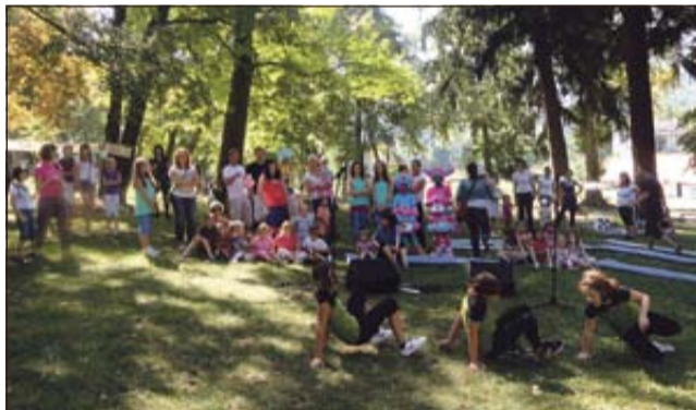
V parku je odmeval otroški živ žav.

BREŽICE - Mladinski center Brežice je minulo soboto izvedel drugi mini festival družine v grajskem parku. Hkrati so pozvali družine na tržnico rabljene otroške opreme, kjer so lahko tudi prodajali otroška oblačila in opremo zanje. V grajskem