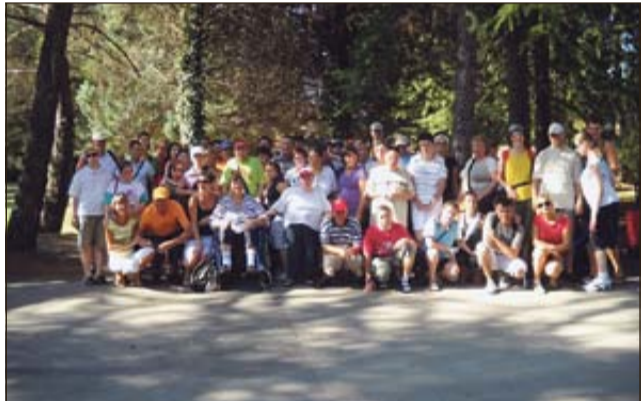
Udeleženci letovanja v Ankaranu

ANKARAN, KRŠKO - Od 22. do 26. avgusta se je 49 odraslih oseb z motnjo v duševnem razvoju, uporabnikov storitev Varstveno delovnega centra (VDC) Krško-Leskovec, ter 13 spremljevalcev udeležilo letovanja ob morju v turističnem naselju Adria v Ankaranu. Osrednji program letovanja je bil namenjen plavanju, učenju plavanja ter različnim aktivnostim za ohranjanje psihofizičnih sposobnosti. Udeleženci so