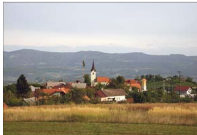
Pogled na del gručastega naselja Gora, s središčno cerkvijo sv. Lovrenca, v neposredni bližini katere so v preteklih letih zgradili gasilski dom ter igrišče.

Kot je povedal Kerin, so tako v letošnjem letu dokončali v lanskem letu začeti obnovi dveh poti 2. reda v skupni dolžini 300 m (odsek Dule - vodohran in Gora - zaselek Rtiče), vzporedno z izgradnjo vodovoda za optiko pa so obnovili tudi vodovodno na-