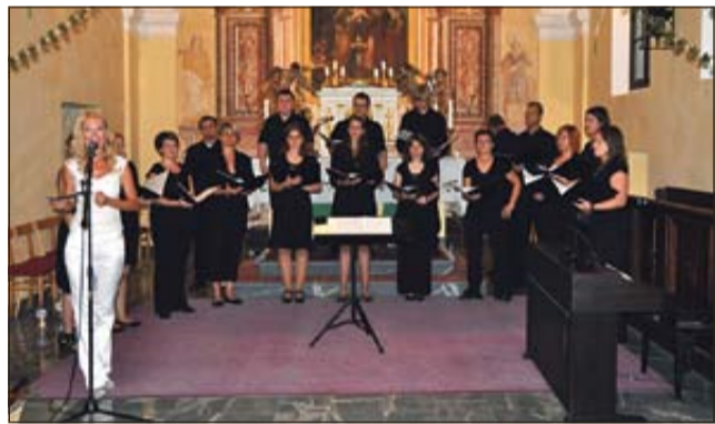
Komorni zbor Trbovlje je zaključil letošnje Anine glasbene večere.