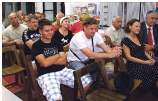
Obiskovalci so prisluhnili Omerzelovim spominom.

Omerzela, ki je bil 23 let pred tem, ko je komaj dopolnil 18 let, izbran med 150 kandidati za enega izmed štirih novih voznikov krškega kluba. V deveti vožnji omenjene dirke so številni zbrani gledalci obnemeli,