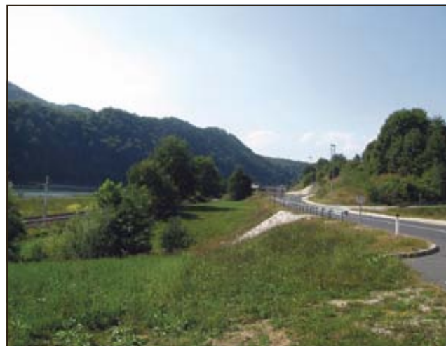
Predvidena lokacija čistilne naprave Orehovo

pričela, projekt pa bo predvidoma končan do konca julija 2012. Občina Sevnica pričakuje dobro sodelovanje z lastniki zemljišč, ki so vključena v izvedbo operacije, ter potrpežljivost vseh občanov ob izvedbi projekta.