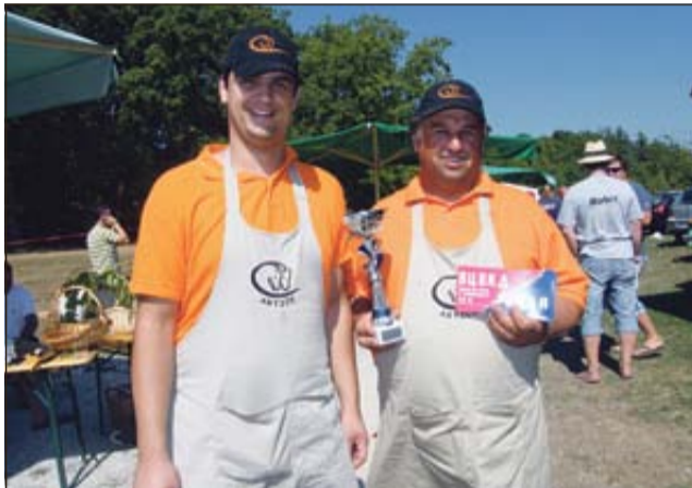
Zmagovalni pokal v kuhanju golaža sta prejela tekmovalca ekipe Konjarji 2.

tiškem igrišču pa sta se med sabo pomerili nogometni ekipi - starejša in mlajša. Zmagovalno lovoriko so odnesli starejši, ki so imeli več športne sreče. Med 16 ekipami v kuhanju golaža pa se je na prvo mesto zavihtela kuharska ekipa Konjarji 2, drugo mesto je zasedla ekipa Bubka 1, tretji najboljši golaž pa je skuhal ekipa Nuša&estrada. Vsem ostalim so podelili priznanja za sodelovanje in oznani-