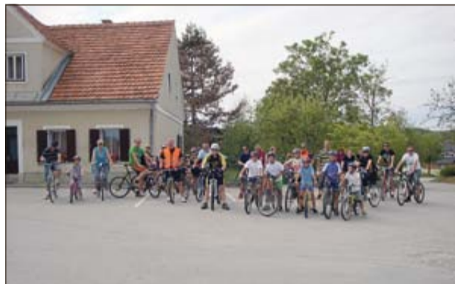
Udeleženci kolesarjenja

BISTRICA OB SOTLI - Člani Kolesarske sekcije Orans iz Bistrice ob Sotli so 28. avgusta izvedli kolesarjenje za vse ljubitelje koles oziroma rekreacije in nanj povabili vse generacije.