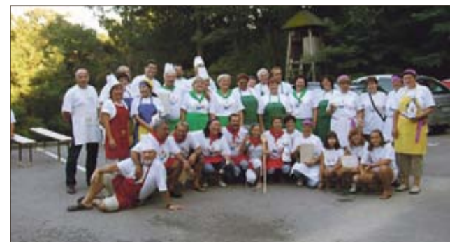
Skupinska slika sodelujočih kuharskih ekip

SELA PRI DOBOVI - V sobotnem popoldnevu, 3. septembra, se je v Selah pri Dobovi, pri lovski koči tamkajšnje Lovske družine, drugo leto zapored v organizaciji Turističnega društva Dobova odvila zabavno-družabna kulinarčna prireditve Krompirjada 2011.