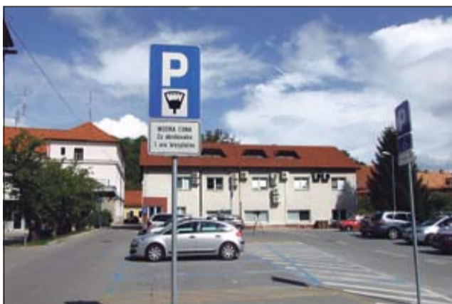
Modra cona pred Občino Krško

novega šolskega leta, a so jo zaradi načrtovane rekonstrukcije ulice odložili. Podrobneje o predvidenih ureditvah mirujočega prometa v Krškem na strani 19.