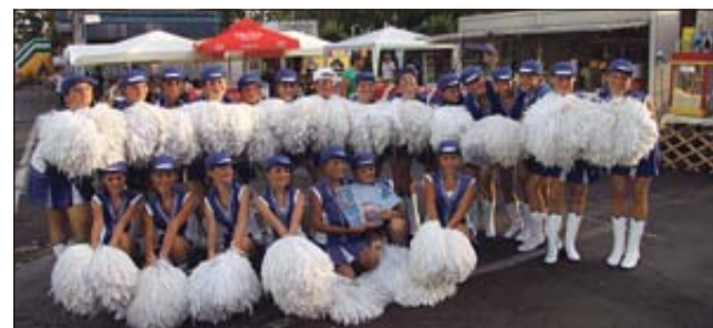
Mažoretna skupina Društva Trg Sevnica

SEVNICA/ZAGREB - V Zagrebu je od 1. do 4. septembra potekalo evropsko prvenstvo mažoretne skupine. Na njem se je predstavila tudi sevniška mažoretna skupina in v močni konkurenci osvojila sedmo mesto (lansko leto je bila osma). »Po napornih treningih, po uspešni turneji po Franciji in še po mnogih drugih