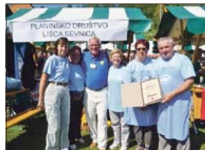
Posavje je zastopalo tudi Planinsko društvo Lisca Sevnica.

LUDMANNSDORF, POSAVJE - 3. septembra se je v avstrijski vasi Ludmannsdorf (slov. Bilčovs) v dolini Rož odvijal 11. svetovni festival praženega krompirja, ki postaja vsako leto večja vsesplošna turistična prireditev. Na več kot petdesetih stojnicah so kuharske sposobnosti s krompirjem preizkušale številne ekipe iz raznih evropskih držav, večina iz Slovenije. Posavje so ugledno zastopale ekipe Planinskega društva Lisca Sevnica, Društvo ljubiteljev praženega krompirja iz Loga pri Boštanju, Društvo motoristov Ketna iz Radeč, Turistično društvo Radeče, Loški zeliščarji, manjkali pa niso niti Šentjernejčani s svojo maskoto - petelinom. Za vseh 5.000 obiskovalcev je bilo krompirja dovolj v najrazličnejših izvedbah in okusih. Tudi domačini, ki so v večini slovensko govoreči, so bili zelo ponosni na prireditev z večinsko slovensko udeležbo.