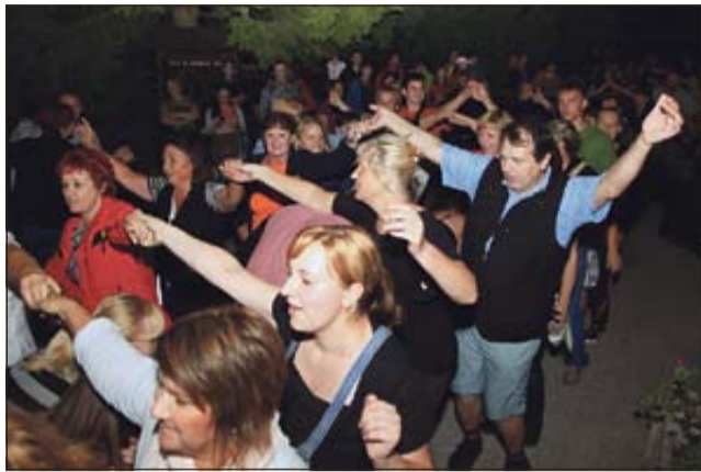
Bohorske noči se je udeležilo preko tisoč obiskovalcev, rajalo in pelo pa se je dolgo v noč.