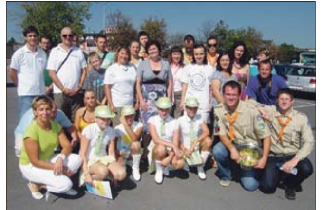
Živahno je bilo tudi v Krškem.

V juniju so festival zaradi slabega vremena predstavili na drugo soboto v septembru, sedaj pa se je še malce poigrala narava in prehitro dozorelo grozdje. Tako je