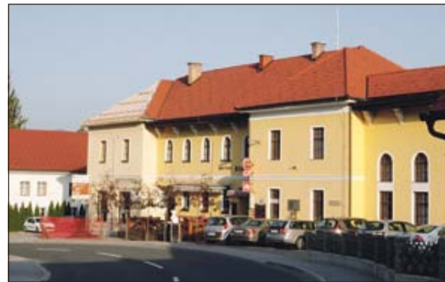
Odprta streha, ki je zdaj že pokrita

BISTRICA OB SOTLI - Tamkajšnja občina in Kmetijska zadruga Šmarje pri Jelšah sta v dogovoru prekrila del strehe na kulturnem domu, ki je bila uničena v katastrofalnem neurju 11. julija.