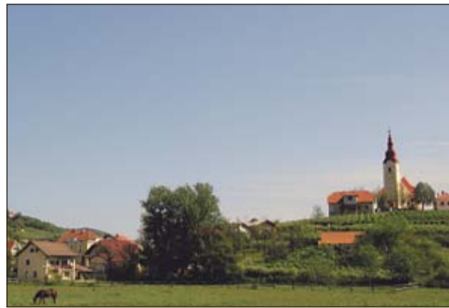
Na hribčku v središču naselja leži cerkev sv. Lovrenca.