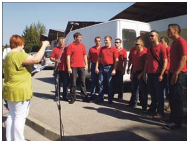
Kapelski pevci so se predstavili v Brežicah.