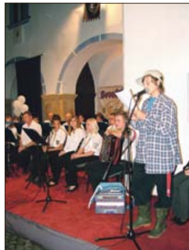
»Blanški mulc« je na šaljiv način predstavil dogajanje v domačem kraju.