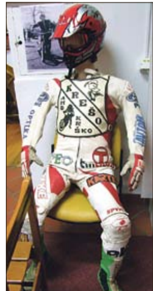
Omerzelova tekmovalna oprema

po nesreči operirali v Kliničnem centru v Ljubljani. Po te-