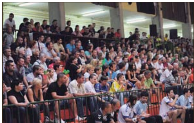
Gledalci so napolnili tribune radeške športne dvorane.

RADEČE - V Radečah se je v okviru občinskega praznika odvijala spektakularna rokometna tekma med RK Celje Pivovarna Laško ter RK Zagreb Croatia Osiguranjem. Organizacije se