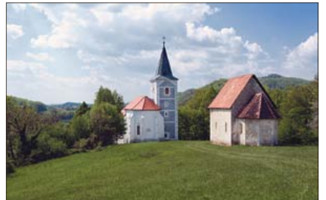
Stare gore nad Podsredo

ZAGORJE PRI LESIČNEM - V Kozjanskem parku obeležujejo 30-letnico ustanovitve, številnim prireditvam pa se pridružuje še odprtje Marijine romarske poti in Lurške jame v Zagorju pri Lesičnem. 8. in 9. oktobra bodo pripravili še tradicionalni, že 12. sejem Praznik kozjanskega jabolka v Podsredi.