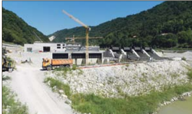
Po izgradnji HE na spodnji Savi (na fotografiji HE Krško) sledi še gradnja HE na srednji Savi.

»Veseli me, da se je našel in uresničil skupni interes pri tako pomembnem projektu za Slovenijo. Načrtovana gradnja hidroelektrarn na srednji Savi ima v treh energetskih podjetjih, ki so k njej pristopila, trdne temelje in poten-