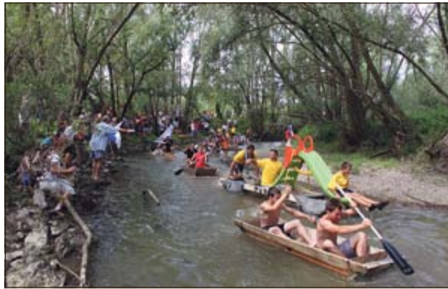
Spust po Sotli s parnicami

BIZELJSKO - Zadnjo nedeljo v avgustu je domače turistično društvo na vzorčni pohod po peti bizeljski pešpoti ob Sotli že s štarta popeljalo 58 pohodnikov, še kar nekaj pa se jih je pridružilo na poti. Zaključili so jo s piknikom in spustom s 'parnicami' po Sotli.