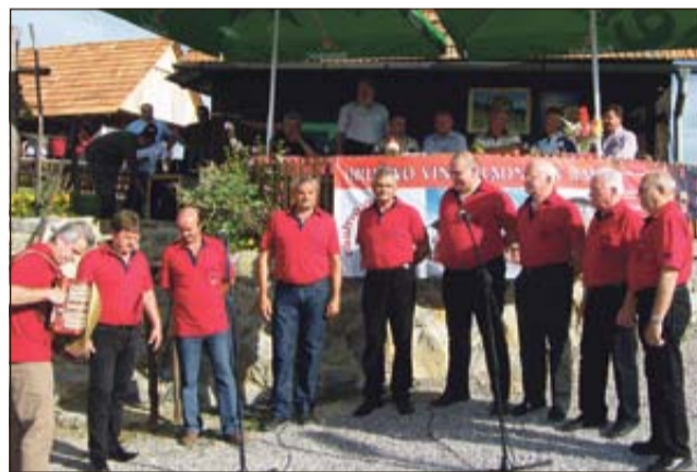
Za uvod v prireditev so zapeli pevci DV Raka.