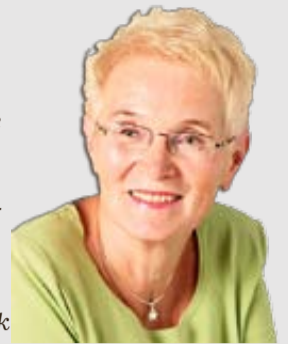
Piše: Natja Jenko Sunčič

znova smeti in kar naprej smeti. Večno smeti in večne smeti. Množične spremljevalke množic. Pravzaprav one same, kot take, niso zakrivila greha. Odpreš Magnum mini sladolead in se kar naenkrat pojavita kar dve. Smeti. Papirček, ovitek in paličica, ko zližeš Magnum mini. Prerežeš Bounty minis family pack, kar pomeni, da boš v hipu zasut s plastificiranimi papirčki. Ki jih ne odvržeš k staremu papirju, temveč, menda, k plastiki. Kupiš znamke B, ko eno nalepiš na kuverto, je za njo že smetka. Razviješ paket krožnikov, kartončkov kolikor hočeš; zdrobiš Bali riževe čokoladke, ostane neke nove sorte papir; plastificiran, v ta boljšem primeru poleg še plastični dodatek kot neka posodica.