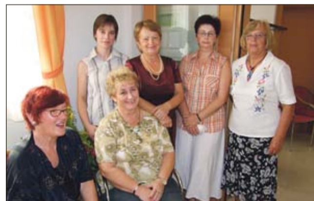
Članice KD Libna so v počastitev krajevnega praznika pripravile enodnevno razstavo.

DOLENJA VAS PRI KRŠKEM - 15. avgusta so krajevni praznik, ki je posvečen izgnancem in ostalim žrtvam druge svetovne vojne iz območja krajevnega skupnosti, obeležili tudi v Dolenji vasi pri Krškem. Vendar pa je ta v primerjavi s preteklimi leti letos potekal bolj odmaknjeno očem širše javnosti, saj medijske hiše, razen s strani Kulturnega društva Libna, katerega dvanajst članic je pripravilo razstavo vezenin, kvačkanih izdelkov, glinenih izdelkov ter slik akril in olje na platnu z naslovom Polepšajmo si dom, o dogodku nismo bile obveščene.