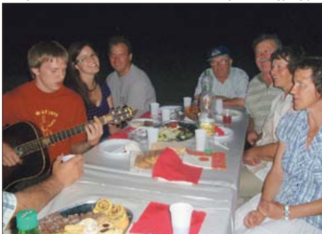
Druženje so popestrili domači glasbeniki.