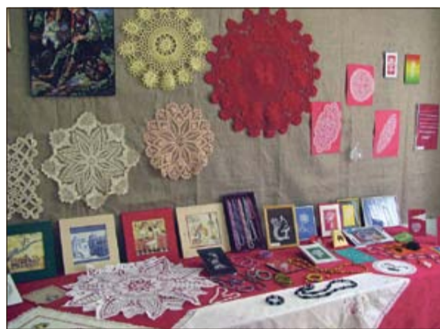
V marcu so pripravili tudi razstavo ustvarjenih ročnih del.

ranju s strani Ministrstva za delo, družino in socialne zadeve v tekočem letu pa se postavlja vprašanje o prihodnosti dnevnega centra. Glede na težko finančno in gospodarsko situacijo bo potrebno razmisliti, ali in v kolikšnem obsegu bo program mogoče izvajati tudi v prihodnosti. Polna zasede-