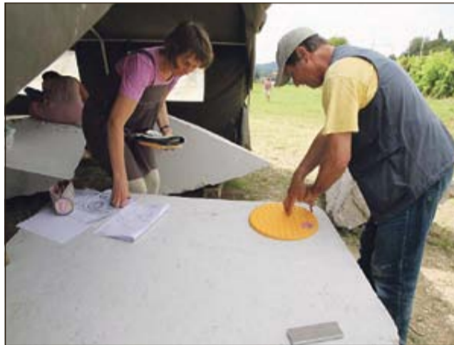
Akademski kipar in geomant Marko Pogačnik pri oblikovanju kozmogramov v nekdanjem sevniškem drevoredu

SEVNICA - V času od 8. do 15. avgusta je potekala na območju bodočega sevniškega mestnega parka klesarska delavnica s postavitvijo 1500 kg težkih litopunkturnih kamnov s kozmogrami pod vodstvom akademskega kiparja, oblikovalca slovenskega grba, priznanega predavatelja, publicista in pisca knjig, avtorja številnih uspešnih litopunkturnih projektov na