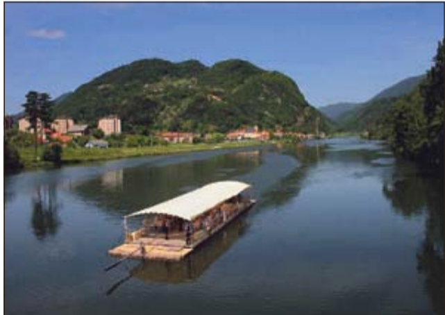
Radeški splav med vožnjo po Savi

Za naše goste smo pripravili pester program. Lokalni vodnik goste sprejme ob 15.00 uri ob pristanu na brežini reke Save v Radečah in jih najprej popelje v staro mestno jedro na ogled kulturne dediščine Radeč (Plečnikov spomenik, graščina Žige Višnjegorskega, cerkev Sv. Petra, dvorec Turn). Gostje se nato vkrcajo na splav, kjer jih sprejme splavarska