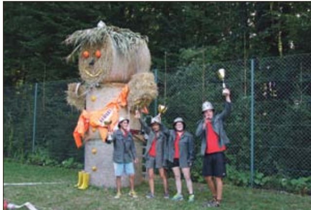
Del zmagovalne ekipe PGD Mali Kamen, ki je maskoto Koprivka prelevila v gasilca