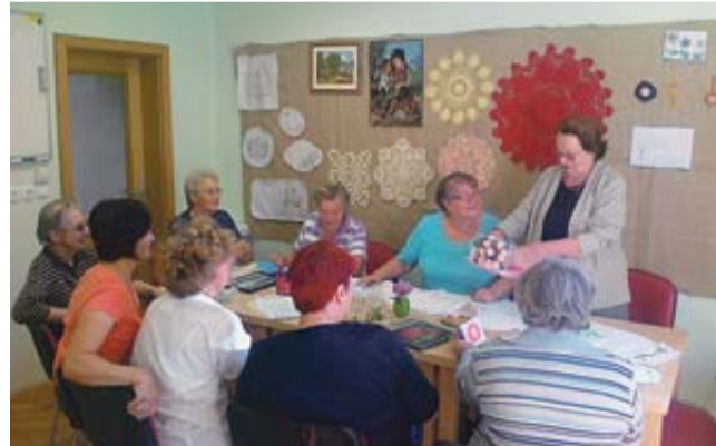
Druženje ročnodelske skupine

nost programov in vse močnejša sled, ki jo center pušča med starejšimi v Sevnici, izvajalce programov spodbuja k iskanju trajnejših rešitev za obstoj in razvoj centra. Vir: Družinski inštitut Zaupanje