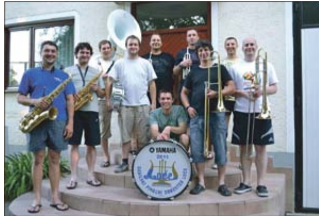
Trobsi Loče - čestitke za zlato priznanje s pohvalo!

LOČE - Člani KD Gasilskega pihalnega orkestra Loče tudi v poletnih mesecih aktivno sodelujejo na različnih dogodkih v bližnjih in daljnih krajih. Letošnje leto je bilo še posebej zelo pestro, saj so imeli v mesecu maju državno tekmovanje pihalnih orkestrrov na Vrhniki, kjer so potrdili, da sodijo med odlične godbe v Sloveniji. Tako kot so začeli leto, so tudi končali - nadvse uspešno in aktivno.