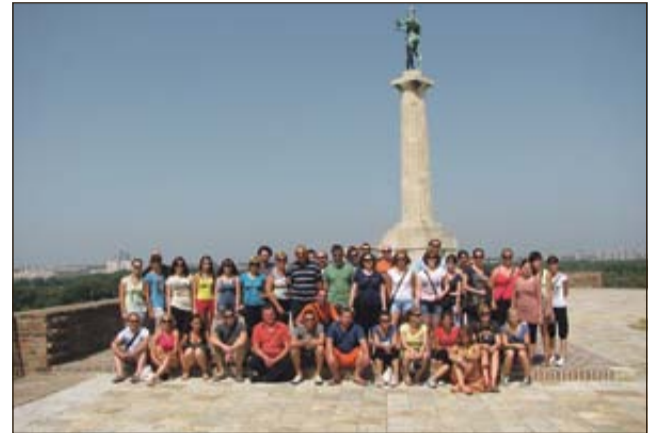
Skupinska fotografija iz Srbije, kjer so se udeležili mednarodnega karnevala v Vrnjački Banji

priznanje s pohvalo. Tričlanska komisija je bila enotnega mnenja glede izvedbe njihovega tekmovalnega programa in jih ocenila z odlično oceno. Po tekmovalnem delu so Trobsi navduševali še dolgo v noč s svojim igranjem ter se navdušeni in polni vtisov v zgodnjih jutranjih urah vrnil domov. Teden dni po Dravogradu pa so se člani Gasilskega pihalnega orkestra Loče odpravili na srečanje pobratenih godb v Avstrijo. Letošnji gostitelj je bila godba Schlosskapelle Neuhaus - Suha iz Avstri-