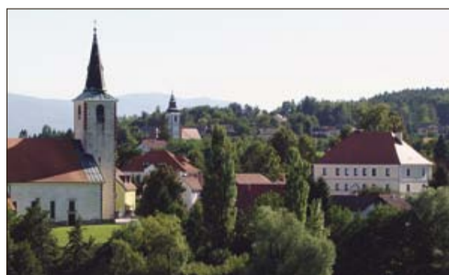
Pogled na leskovško župnijsko cerkev Žalostne Matere Božje, zadaj podružnična cerkev sv. Ane, desno pa objekt, v katerem so lani odprli enoto vrtca Vila

Med letošnjimi sta že realizirani obnova cestne infrastrukture in kanalizacije Velika vas - Gorenja vas ter odvodnjavanje v Lokah, tem pa letos sledijo še obnova pešpoti pri VDC Leskovec - Krško, ureditev ceste v Tršljavcu, studenčka v Venišah ter vodnjaka v spodnjem predelu Leskovca, obnovitev teniškega igrišča v Žadovinku in ureditev ceste k cerkvi sv. Ane v Leskovcu, katere zaključek je predviden v prihodnjem letu. V teku je tudi ureditev cestne infrastrukture s kanalizacijo na relaciji Gmajna - zgornji predel Veniš in postopki za