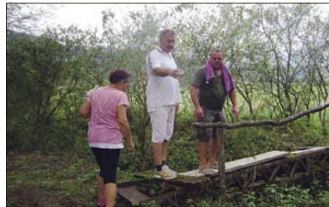
Avgustovska izvidnica pobudnikov pešpoti

BIZELJSKO - Tamkajšnje turistično društvo je na pobudo domačinov zarisalo peto pešpot, ki bo vodila ob Sotli. Poizkusno se lahko po njej podate 28. avgusta.