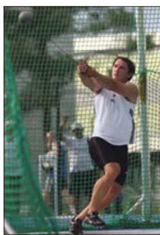
Kozmus na DP v Kopru