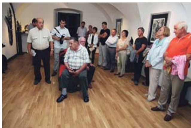
Obiskovalke in obiskovalci so z zanimanjem prisluhnili Stoparjevi pripovedi o življenju in delu sevniškega rojaka, živečega v Franciji od leta 1964.

»Ker je kolektivni spomin 'minljiva roba', sem se odločil, da bom v grajskem oknu Radogost gostil tudi osebe, ki segajo samo v jutranje svitanje naših likovnih dni. Danes, ko je v 'jervasu' človeške notranjosti umanjalo lepega in vrednot in se vanj steka vse več egoizma in je vrednoto zamenjala vrednost, je prav, da se zavemo začetkov, ki niso naši. Smo samo več ali manj uspešni nadaljevalci ustvarjalnosti 'velikih ljudi' v preteklosti, katerih nauk, zglednost in delo bolj v večji ali manjši meri nadgrajujemo. Moje vedenje in spomin seže do začetka moje dobe leta 1945. Tu se začne zbir zarij, ki so me razsvetljevale. Sevnica je bogata teh ljudi. Omejil se bom na likovnost, kajti če bi naštel vse kulturnike, ki so dali pečat Sevnici, je ta prostor