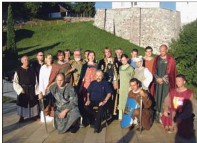
Igralke in igralci po zaključeni vaji

Igralsko zasedbo sestavlja 22 igralcev in igralk, ki so v glavnem domačini. Pridružili se jim bodo še stažisti - vojaki iz Društva Srednjeveški najemniki ter Krekova konjenica iz Šentjanža. »Čeprav je od nekdanj zelo pomembnega gradu Svibno ostalo bore malo, to ne pomeni, da ne nosi velikih zgodb - dobrih zgodb, ki bi jih številni radi slišali in videli. To bomo predstavili konec letošnjega avgusta na Svibnem,« je zadovoljen z dogajanjem