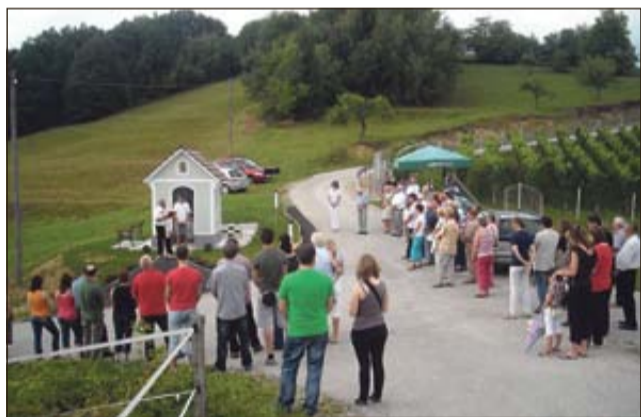
Zbrani pri blagoslovu kapelice