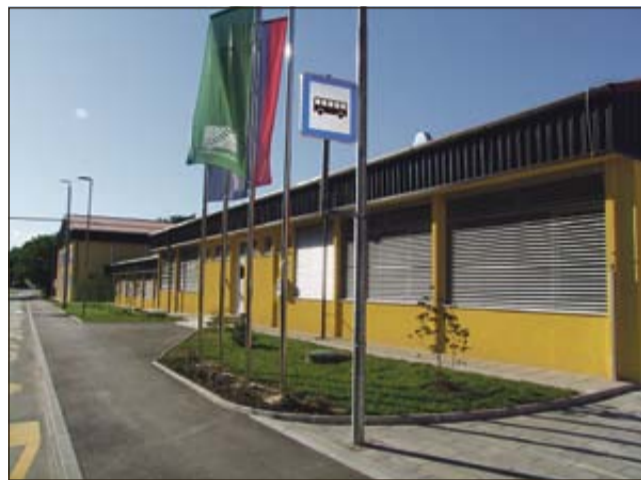
Obnovljena šola na Raki (foto: B. M.)

Največje pridobitve v občini Krško bodo z novim šolskim letom deležni na Raki, kjer se zaključuje novogradnja vrtca in energetska sanacija šolske stavbe. Kar 4,3 milijone evrov teška investicija (večinski delež je zagotovila Občina Krško, Ministrstvo za šolstvo in šport je primaknilo dobrega pol milijona evrov) se je pričela že leta 2009, zara-