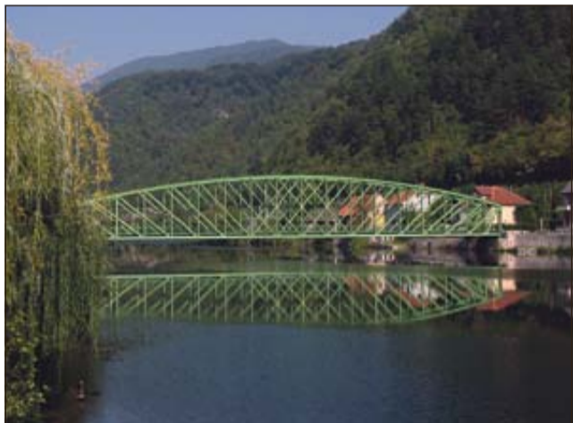
Železni most v Radečah

V začetku avgusta je bil med KTRC Radeče ter Rimskimi termami, Thermano Laško, Termami Dobrna in Termami Topolšica sklenjen dogovor, da v mesecu avgustu in septembru vsak četrtek popoldan vozi t. i. »Zdraviliški splav«.