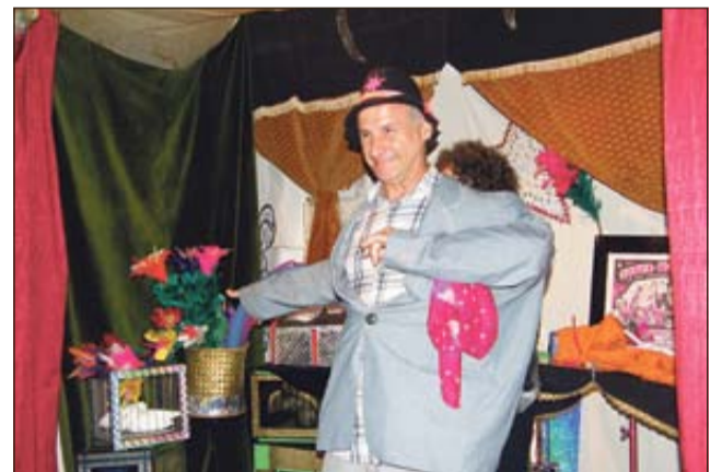
Janko v elementu v eni izmed točk

bil k sodelovanju prisotne, ki so bili tako sproščeni, kot bi prizore vadili vsak dan. Polni vtisov smo kar obsedeli, nato pa si delili mnenja še na dvorišču, ko je iz težkih oblakov prijetno priplesalo nekaj dežnih kapelj.