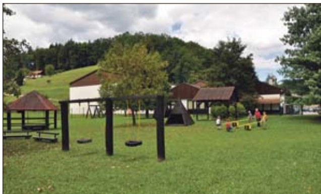
Vrtec bo zgrajen ob obstoječem objektu nove šole v Krmelju.

Januarja letos je bil s strani države pridobljen pozitiven sklep o sofinanciranju v vrednosti 1.050.000 evrov, spomladi pa izveden javni razpis za izbor izvajalca. Vrtec v Krmelju bo gradilo podjetje GPI Tehnika d.o.o. iz Novega mesta, ki bo z deli pričelo po podpisu pogodbe in jih zaključilo v letu 2012.