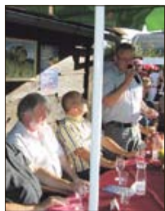
CVIČKOV VEČER NA RAKI

Naši aduti: kranjska klobasa, pražen krompir in cviček