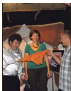
VSAK DAN NOVINAR - EN DAN NEVLADNIK