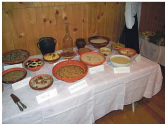
Na prireditvi je bilo predstavljenih kar 40 jedi.

JELENIK PRI RAKI - 15. julija je bila na Jeleniku pri Raki predstavitev starih jedi, kot so jih nekoč kuhale naše babice. Prireditev, katere se je udeležilo okoli 60 ljudi, je potekala v okviru Etnološkega društva Terica in jo je delno sofinancirala Občina Krško. Devet članic oziroma članov društva je pripravilo in predstavilo kar 40 jedi. V skednju so bile jedi razstavljene v lončenih posodah, pod lipo pa se je odvijal kultur-