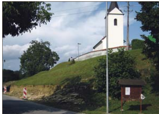
Pod cerkvijo svetega Martina so že začeli s prvimi deli za ureditev pločnika.