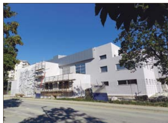
Gradnja športne dvorane pri OŠ Brežice

Počitniški čas so za obnovitvena dela izkoristili tudi v radeški OŠ Marjana Nemca,