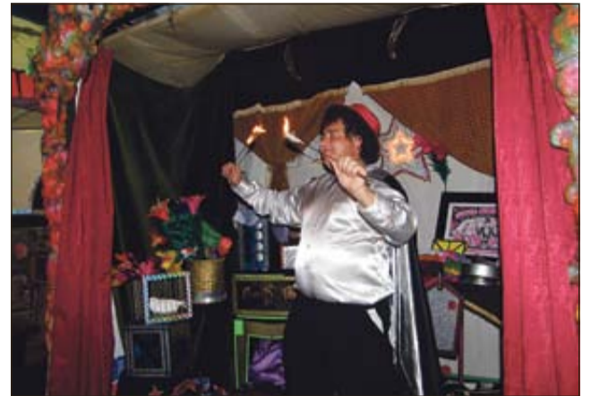
Zanimivi triki zahtevajo veliko vaje.